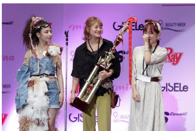
(写真左) GLOWING BATTLE for Studentの様子 (写真右) GLOWING BATTLE for Student 優勝の3人