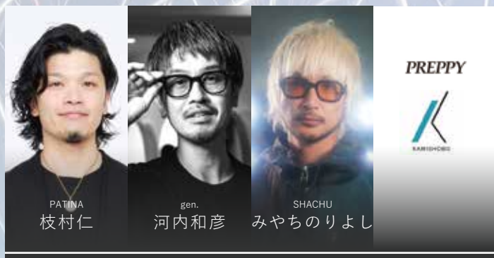
ウィッグカット部門