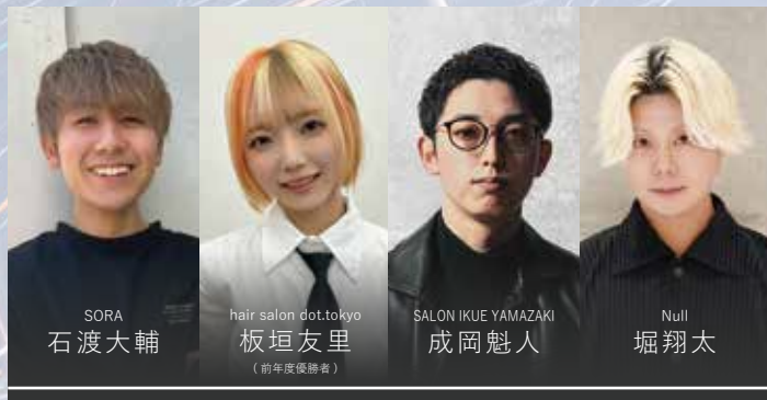
ワインディング部門