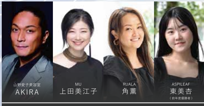
アップスタイル部門